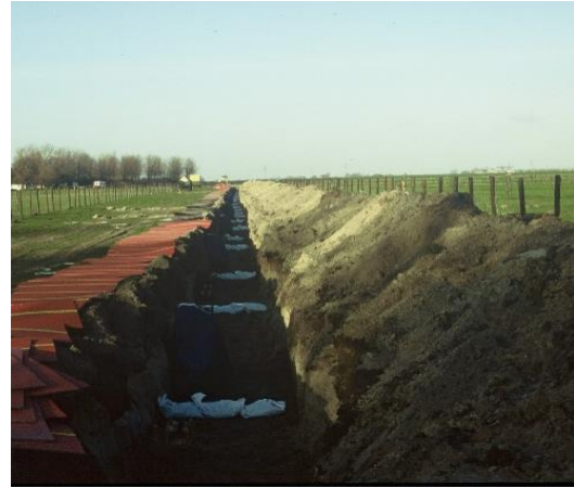
Sleuf t.b.v. aanleg leiding waarvan gebruik wordt gemaakt voor het uitvoeren van wandonderzoek