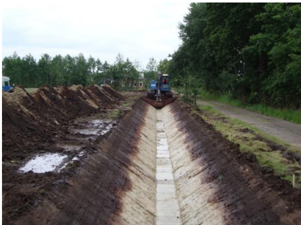
Slootwand waaraan wandonderzoek worden uitgevoerd