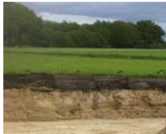
Bouwput waarvan men gebruik kan maken voor wandonderzoek

Wandonderzoek kan worden uitgevoerd vanuit verschillende achtergronden ofwel vakgebieden. Denk daarbij aan bodemkunde, geologie, geotechniek en archeologie. Alleen binnen het vakgebied bodemkunde wordt momenteel wandonderzoek uitgevoerd waarbij de gegevens volgens een bepaalde systematiek en op een gestandaardiseerde wijze worden gegenereerd en vastgelegd. Bij andere vakgebieden lijkt dit niet het geval te zijn en wordt het gehele onderzoek uitgewerkt tot een conclusie in de vorm van een rapportage. Voor wandonderzoek wordt daarom vooralsnog alleen het bodemkundig wandonderzoek ingebracht in de BRO. Voor bodemkunde geldt dat het wandonderzoek wordt vastgelegd als puntlocatie met een indicatie van de breedte van de wand waarop het onderzoek heeft plaatsgevonden en een mogelijke richting ten opzichte van het noorden.