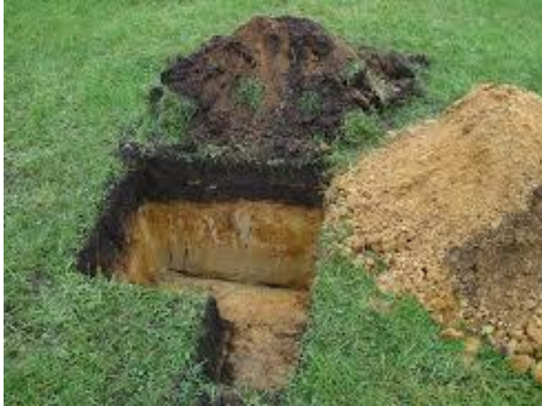
Profielkuil welke specifiek voor het wandonderzoek is gemaakt

gedaan aan de vloeroppervlakte. Het onderzoek aan het vloeroppervlakte is voor wandonderzoek uitgesloten.